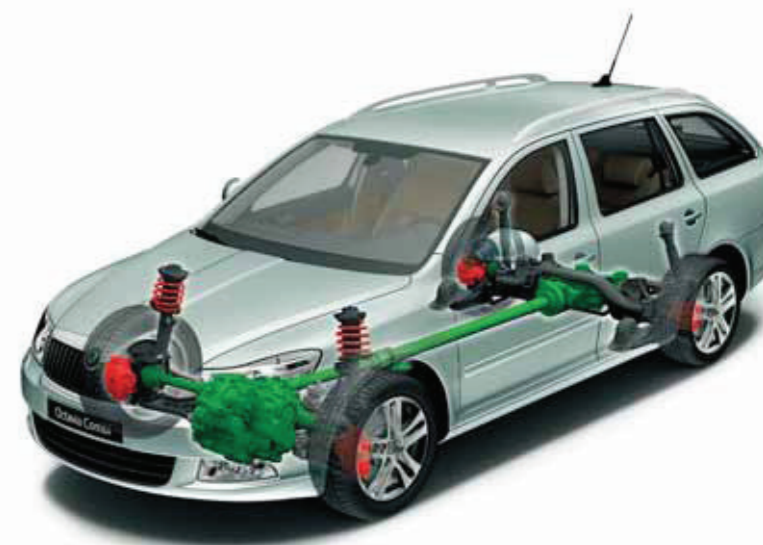
Octavia Combi cu tracțiune integrală și cuplaj Haldex generația a 4-a (disponibilă pentru motoarele 1.8 TSI/118kW, 1.6 TDI CR DPF/77kW și 2.0 TDI CR DPF/103kW)