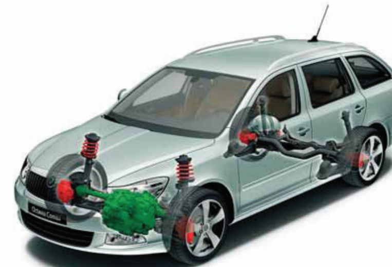
Octavia Combi cu tracțiune integrală (disponibilă pentru toate variantele de motorizare)