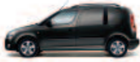
Negru Magic cu efect perlat