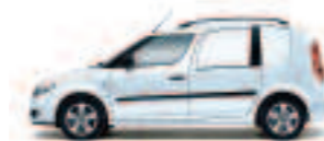
Argintiu Brilliant metalizat